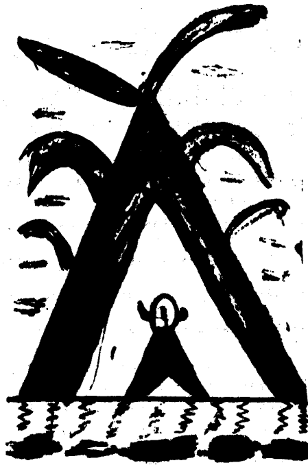
El pueblo suspendido v.122

pele-le 22 kuku-naa-le neka pir-mai-te-ti 15 ukakka se ye /todo/amarrado-ir lex. ( ir amarrado )- part. pas. /sitio/circular- aux. ( estar acostado ) /- perf.-nom. /extremidad- dir. ( hacia )- suf. voc. // El Nele Ukkurwar está mirando allá donde todo, por todas partes, está bien amarrado 23